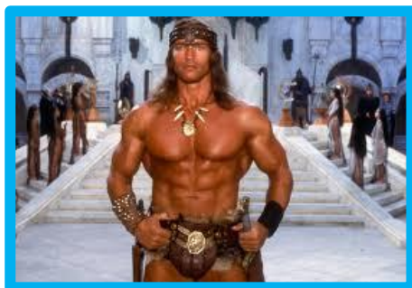
Kulturista a herec Arnold Schwarzeneger pochádza z Rakúska