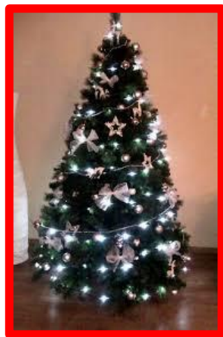
Vianočný stromček pochádza z Nemecka